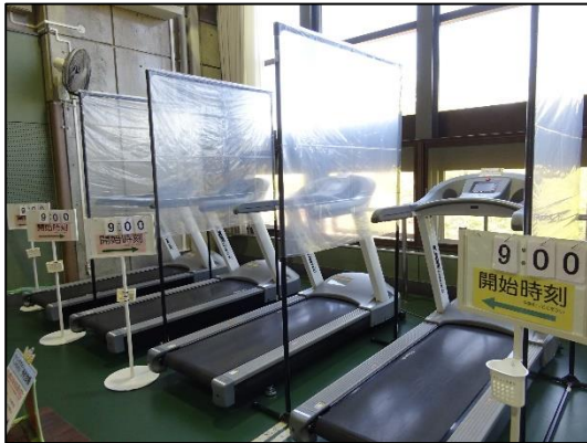
ラボード(ランニングマシン)