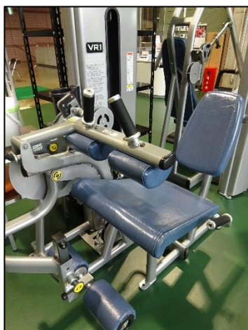
レッグエクステンション/レッグカール