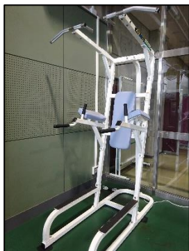
レッグプレス/チン&ディップ 腹直筋下部 広背筋 上腕三頭筋 大胸筋部