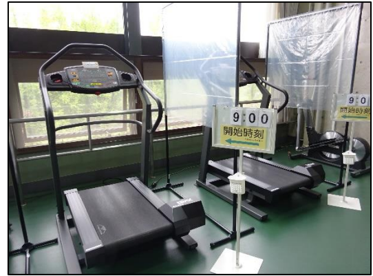
マイマウンテン(ウォーキングマシン)