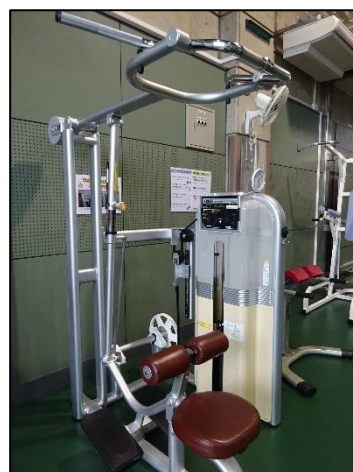
ラットアイソレータ