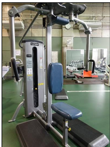
フライ/リアデルト