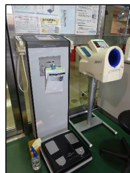
体組成計・血圧計