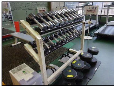
ダンベル 0.5 kg～30.0 kg