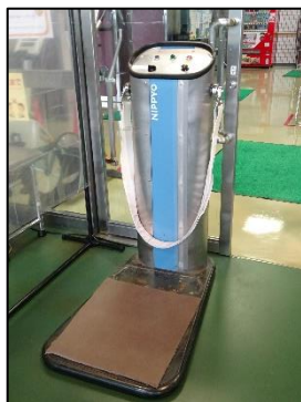
ベルトバイブレーター