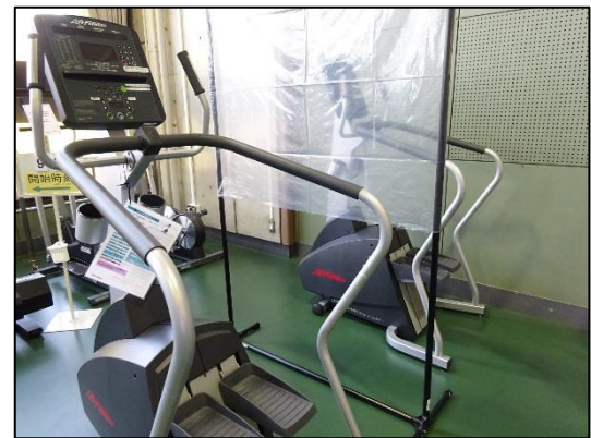
ステアクライマー