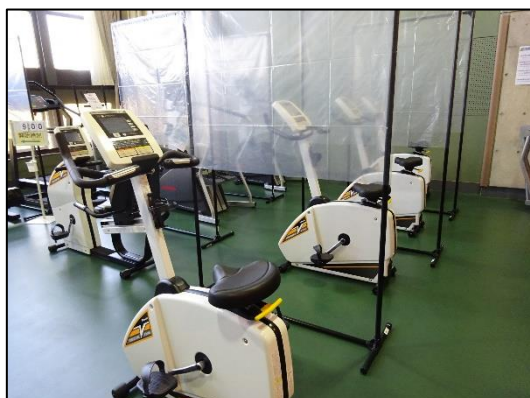
コードレスバイク