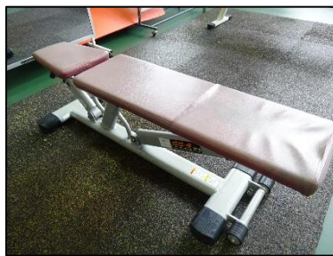
アジャスタブルベンチ