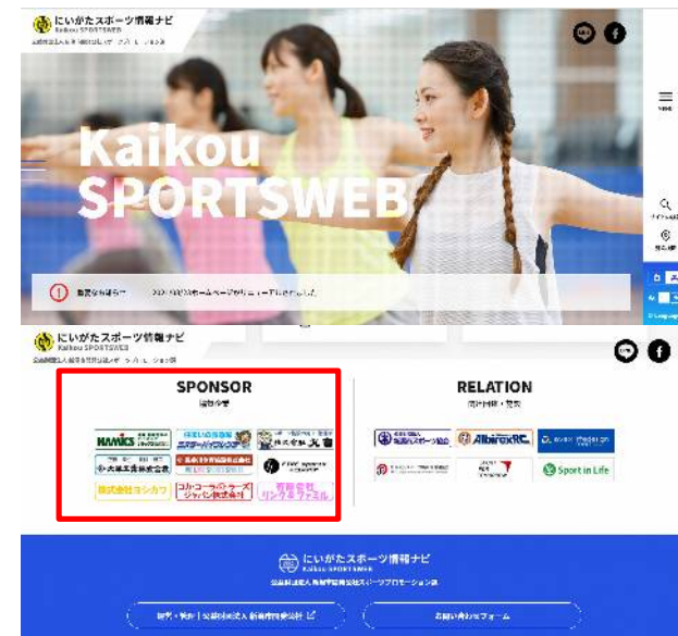
トップページイメージ