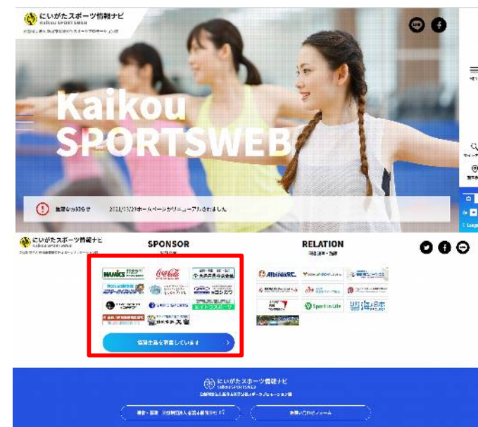
トップページイメージ